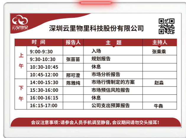
DS116 11.6英寸纤薄款电子标签

DS116 是云里物里针对办公标识、工业仓储标识、零售促销等信息展示场景研发的轻奢型电子标签，有黑白两种颜色的面板可选；采用金属边框设计，高端有档次；整机厚度仅 8.2mm，纤薄有型；高容量可更换电池，延长产品使用周期。