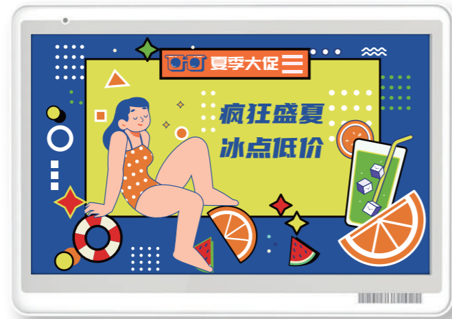
RS075 七彩款单面屏电子标签