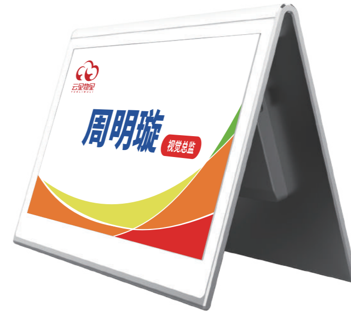
RS075V 七彩款V型智能电子桌牌